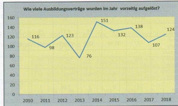
(Entwicklung 2010 – 2018)

b) Vorzeitig aufgelöst wurden im Jahr 2018 (in allen drei Ausbildungsjahren) insgesamt 124 Verträge.